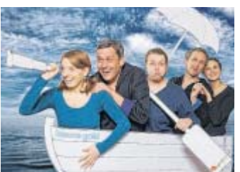
Volle Kraft voraus: Die Akteure auf Wasserreise.

Sechs Akteure des Augenblick-Theaters laden ein, die be-