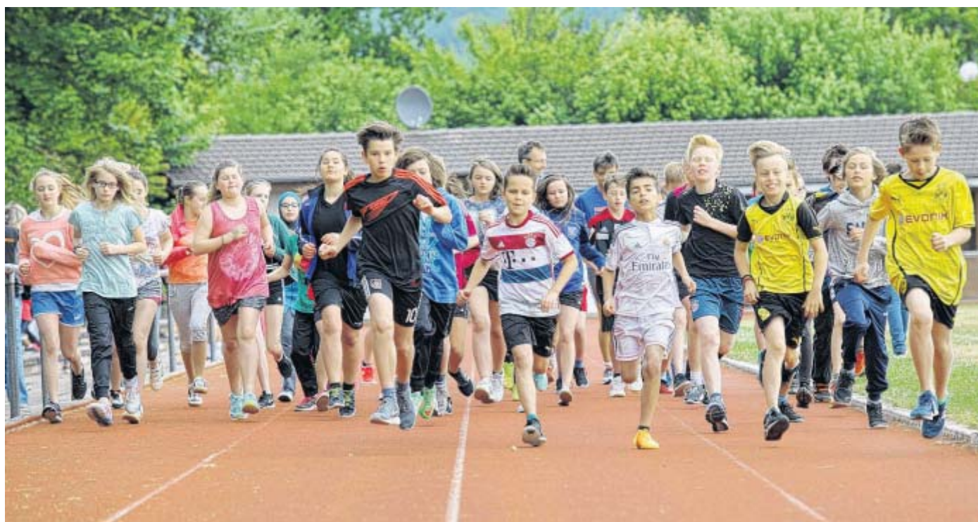
Gut motiviert: Bevor die Schüler und Lehrer der Gesamtschule Hüllhorst zum Sponsorenlauf starteten, gaben Mitglieder des Vereins „Starke Kinder“ einen Einblick in die Lebensumstände in Burkina Faso und in die Vereinsarbeit.

Babylkorbchen , Babys anonym und strafrei abgeben, rund um die Uhr, Hauptstr. 128, Tel. (05744) 50 90 50.