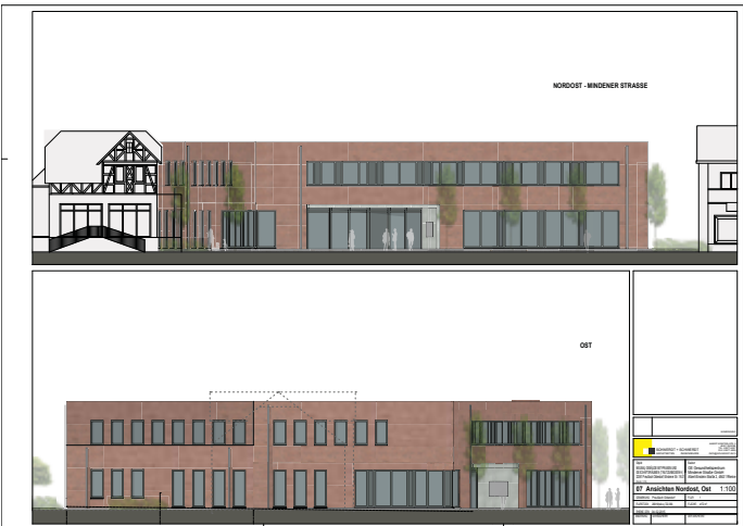
Ansicht von Nordost und Osten: So soll das neue Gesundheitszentrum aussehen. Im Artikel vom 4./5. Juli wurde fälschlicherweise die alte Planung gezeigt.

Plan sei, das Ärztehaus im dritten Quartal 2016 zu eröffnen.