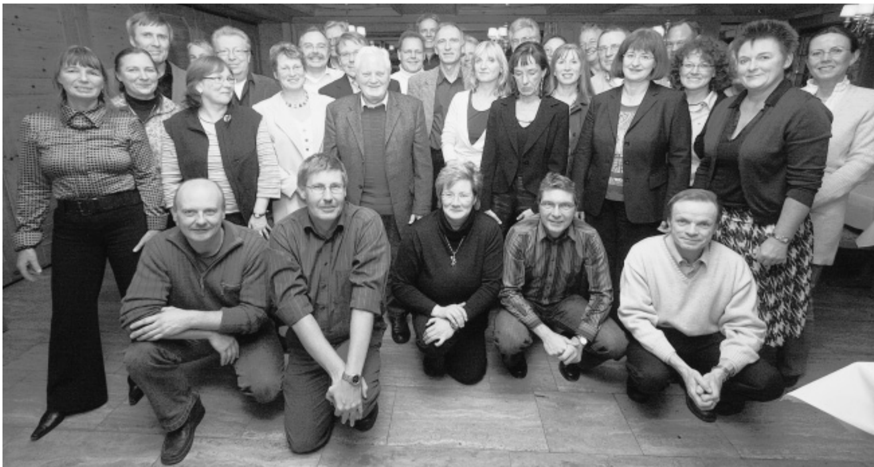
Jahrgang '77: Aus allen Himmelsrichtungen kamen sie zurück nach Wittekind, die 34 Schülerinnen und Schüler, die vor drei Jahrzehnten ihre Reifeprüfung abgelegt hatten. Selbst aus dem Ausland fanden sie den Weg nach Lübbecke.