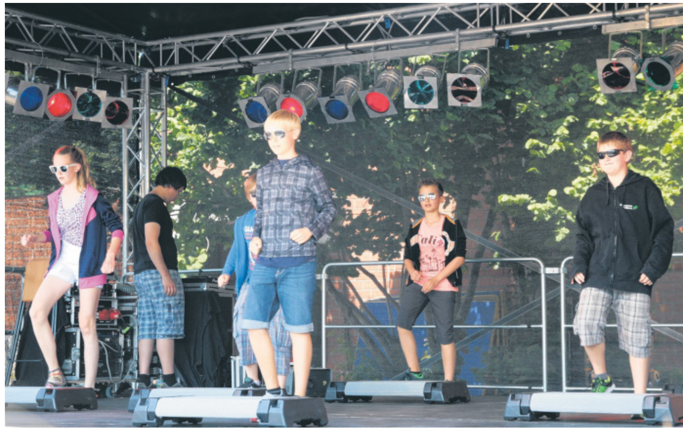
Abwechslungsreiches Bühnenprogramm: Die Jungen und Mädchen der Schule hatten sich einiges einfallen lassen, um die Gäste der Jubiläumsfeier zu unterhalten.

Immer zur Seite stünden den Pädagogen die treuen Verbündeten: Eltern, politische Vereine und die örtliche Wirtschaft. Dafür sprachen die beiden Lehrer ihren Dank aus. Nach dem offiziellen Teil eröffnete die Dorfkapelle Oberbauerschaft mit der Bläsergruppe der Gesamtschule das Schul-