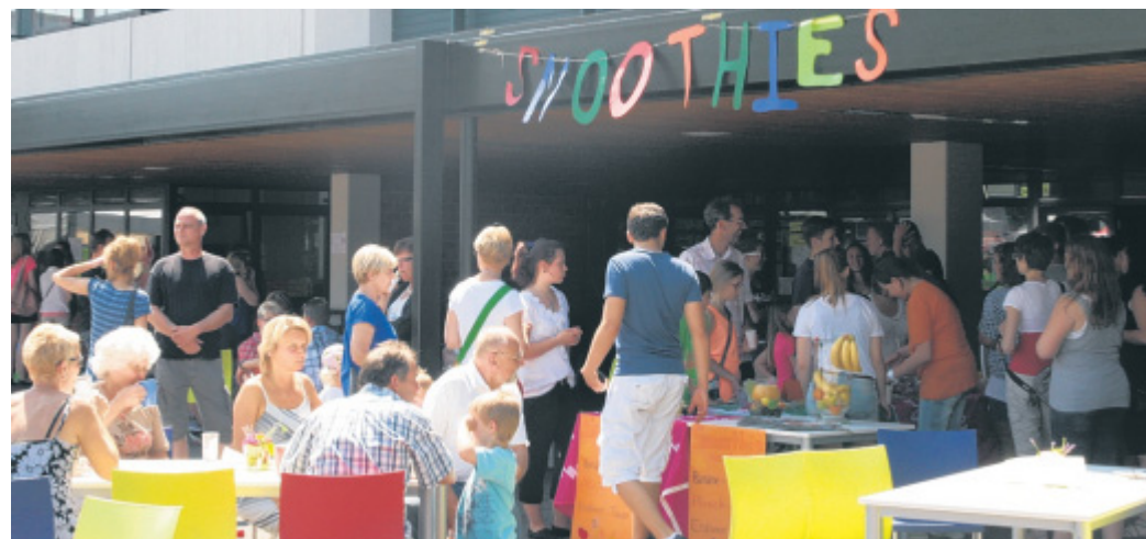
Herrliches Sommerwetter: Da kamen auch Eltern, Großeltern und Geschwister der Gesamtschüler gern, um den Nachmittag gemeinsam zu genießen. Für kühle Getränke war gesorgt.