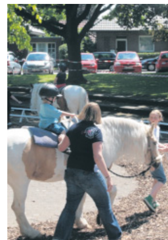
Spaß beim Reiten: Hier standen die Mädchen Schlange.

fest. Vier Bühnen boten reichlich Unterhaltungsprogramm. Unter anderem wurden Theater-