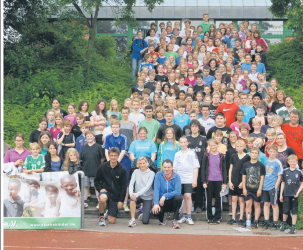
Helfen notleidenden Kindern: 200 Läufer gingen beim aktuellen Sponsorenlauf der Gesamtschule Hüllhorst an den Start. Es war die vierte Aktion dieser Art, mit der die Gesamtschule die Projekte des Hüllhorster Vereins „Starke Kinder“ im afrikanischen Land Burkina Faso unterstützt.

■ Hüllhorst (nw). 1.240 Runden sind beim vierten Sponsorenlauf für notleidende Kinder in Burkina Faso gelaufen worden. Dieses Mal waren auf dem Sportplatz an der Gesamtschule Hüllhorst rund 200 Teilnehmer gestartet. Beteiligt haben sich an der Benefizaktion, die zusammen mit dem Hüllhorster Verein „Starke Kinder“ veranstaltet wurde, alle sechsten Jahrgänge, ein Religionskurs des neun-